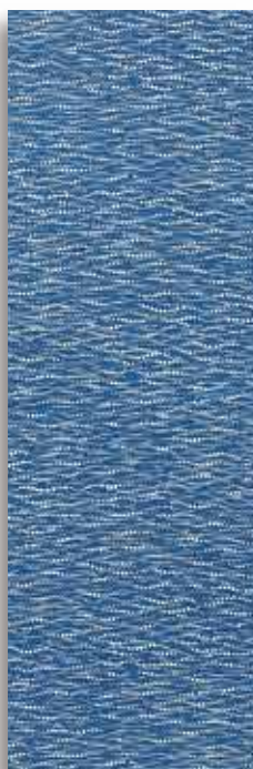
長板中形着尺「漣文」