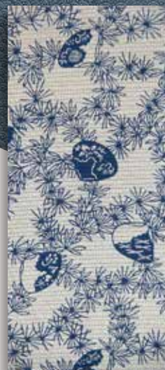
藍形染着物「貝藻文」